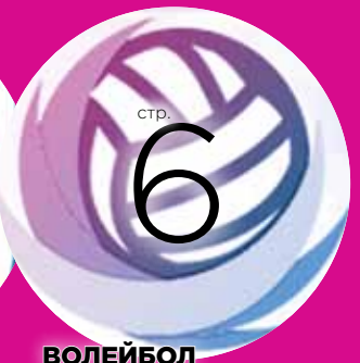
ВОЛЕЙБОЛ Успех спустя 27 лет