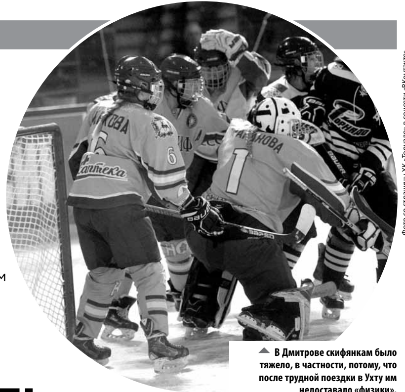
▲ В Дмитрове скифянкам было тяжело, в частности, потому, что после трудной поездки в Ухту им не хватало «физики».

! В пятом матче ЦСКА – «Йокерит» (1:2 ОТ) был установлен рекорд КХЛ по продолжительности игры. Соперники бились 142 минуты 9 секунд игрового времени. Противостояние началось в 19.30 по московскому времени, а закончилось в 01.33.