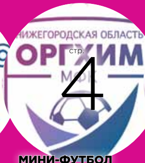
МИНИ-ФУТБОЛ Пропустили вперёд конкурента