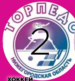
ХОККЕЙ Курс на перестройку?