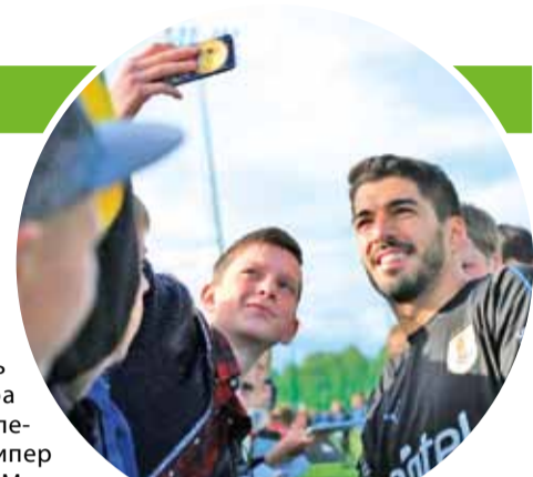
Снимок с Луисом Суаресом – это память на всю жизнь.

– Все соперники в группе представляются нам одинаковыми по силам. Чтобы потом не было неприятных сюрпризов, мы нико-