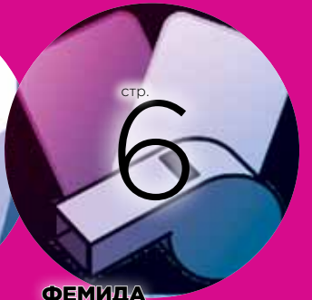
ФЕМИДА Игра по правилам