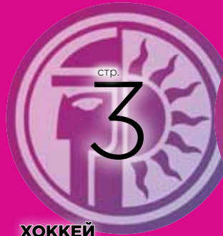
ХОККЕЙ Вновь в строю чемпионки