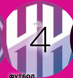
ФУТБОЛ В четвёрке лучших