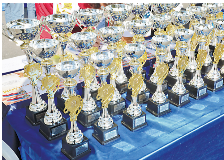
Кубки для лауреатов эстафеты.