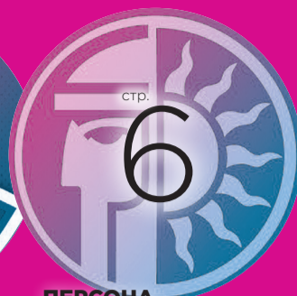
ПЕРСОНА НОВАЯ КРАСАВИЦА НА ЛЬДУ «НАГОРНОГО»