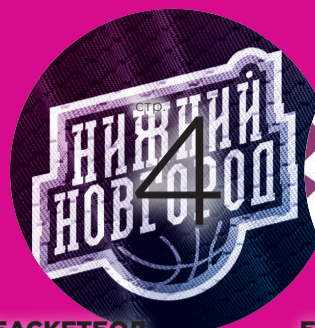
БАСКЕТБОЛ ИГРОВЫЕ ПЕРЕПАДЫ ГУЛЛИВЕРОВ