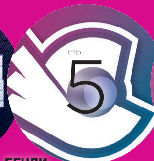
БЕНДИ АРЕНДОВАЛИ... ПАЛОЧКУ-ВЫРУЧАЛОЧКУ