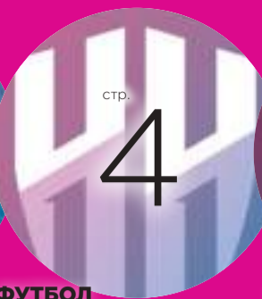
ФУТБОЛ ФНЛ: НЕИЗБЕЖНОСТЬ ОБНОВЛЕНИЯ