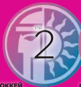
ХОККЕЙ СКИФЯНКИ УКРЕПИЛИ ПОРЯДКИ