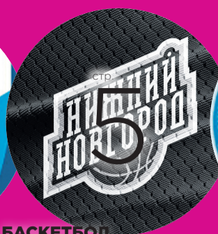
БАСКЕТБОЛ ГРУППА «ГОРОЖАН» В ЛИГЕ ЧЕМПИОНОВ