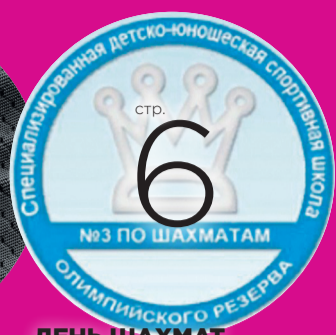
ДЕНЬ ШАХМАТ СЛУЖИТЕЛЬ КАИССЫ КОНСТАНТИН ВИНОКУРОВ