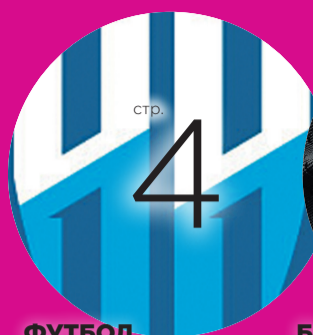
ФУТБОЛ ОЧЕРТАНИЯ СЕЗОНА ФНЛ