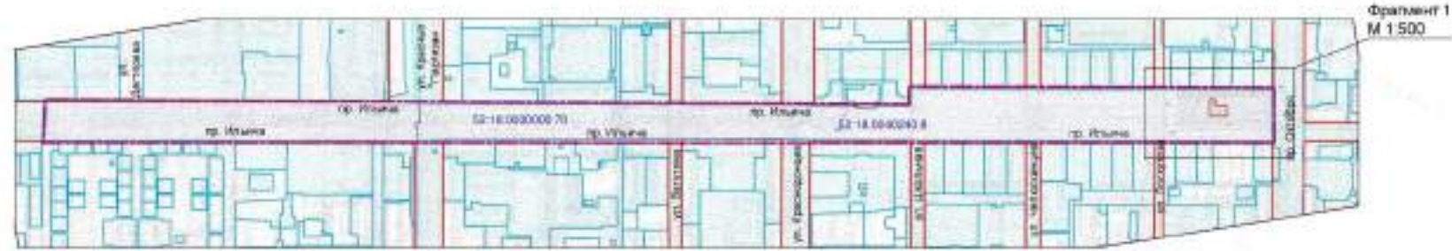
Фрагмент 1 М 1:500