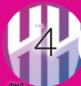
ФНЛ СУПЕРКАМБЭК В КРАСНОДАРЕ