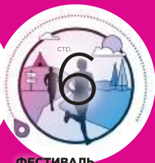
ФЕСТИВАЛЬ РАСШИРИЛ ТРЕЙЛ ГРАНИЦЫ