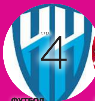
ФУТБОЛ РАЗГРОМ, СТАВШИЙ РЕКОРДОМ