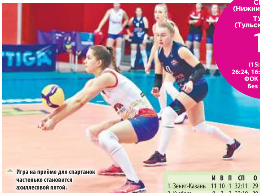
Игра на приёме для спартакчанки становится ахиллесовой пятой.