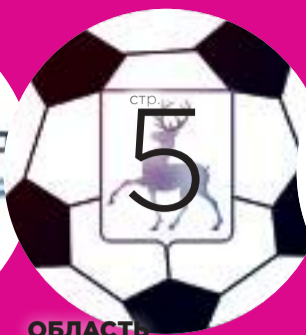
ОБЛАСТЬ ДУБЛЬ «ВОЛНЫ» СТАЛ ЧЕМПИОНОМ