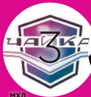
МХЛ ПРЕТЕНДУЕМ НА ПЕРВОЕ МЕСТО