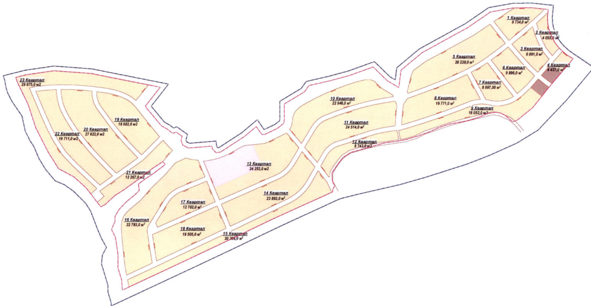
Схема расчетных кварталов