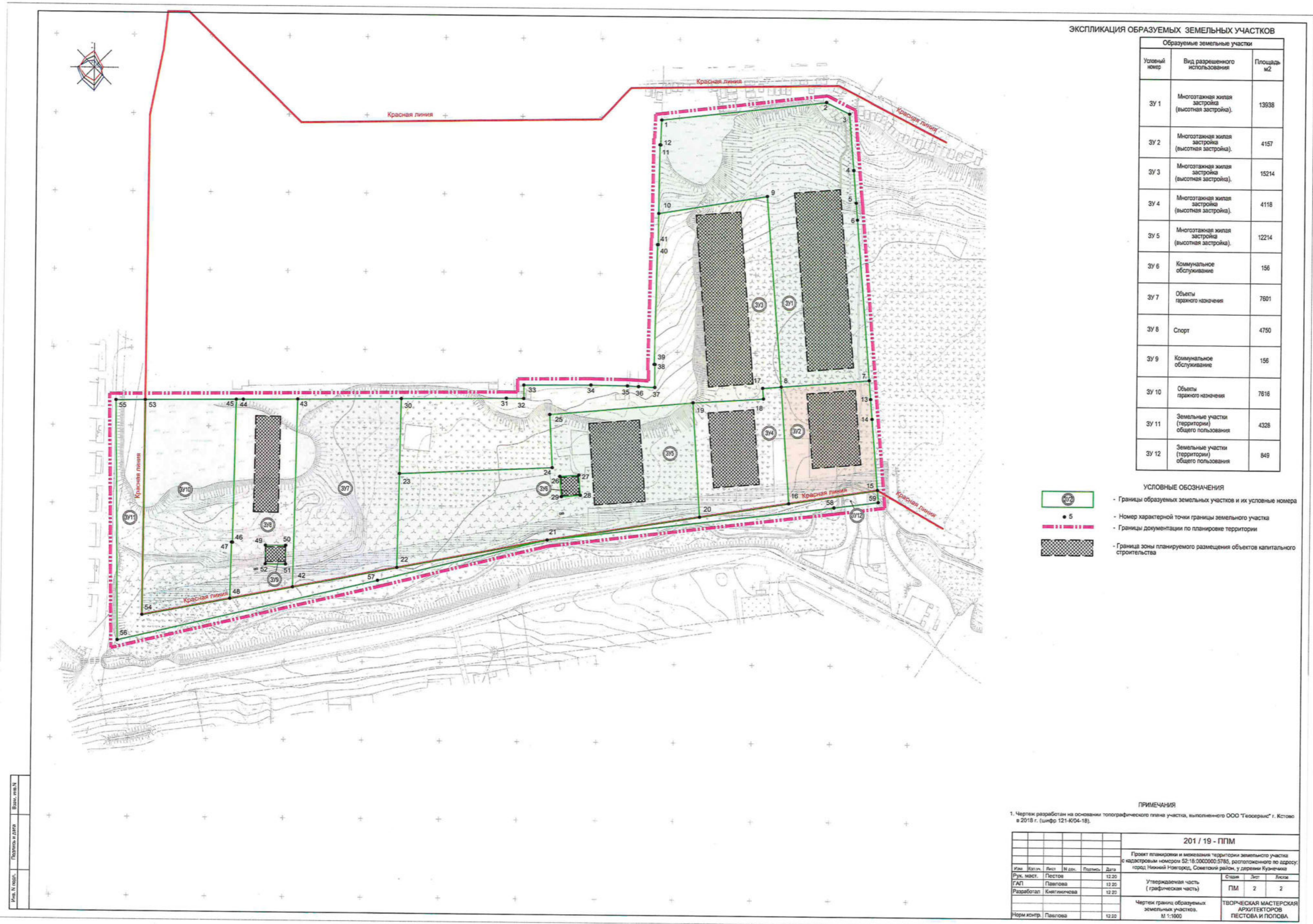
ЭКСПЛИКАЦИЯ ОБРАЗУЕМЫХ ЗЕМЕЛЬНЫХ УЧАСТКОВ