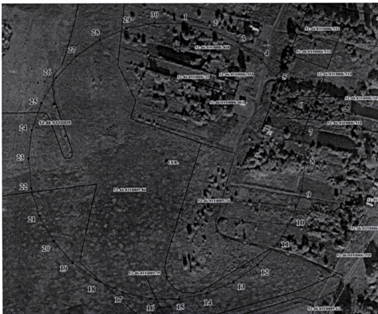
Координаты характерных точек границы третьего пояса ЗСО скважины ООО «Жданово-3»

3. Граница третьего пояса ЗСО скважины ООО «Жданово-3» устанавливается в форме окружности радиусом 172,0 м от оси скважины.