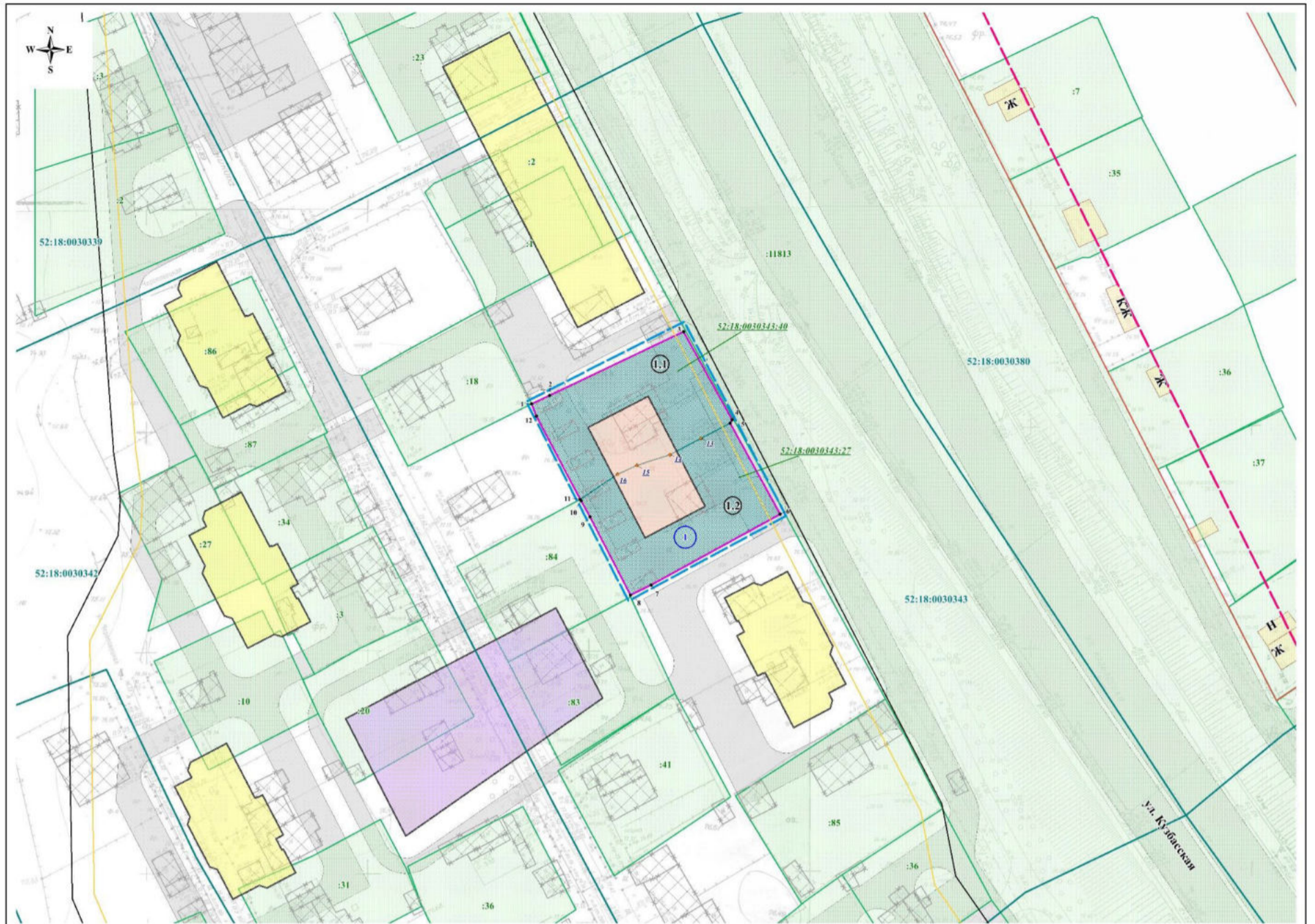
Экспликация образуемых и изменяемых земельных участков на кадастровом плане территории