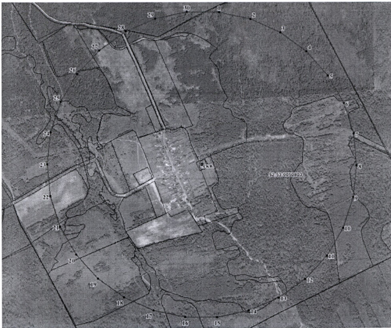
Координаты характерных точек границы третьего пояса ЗСО водозаборной скважины № 1 АО «Выксунский Водоканал»