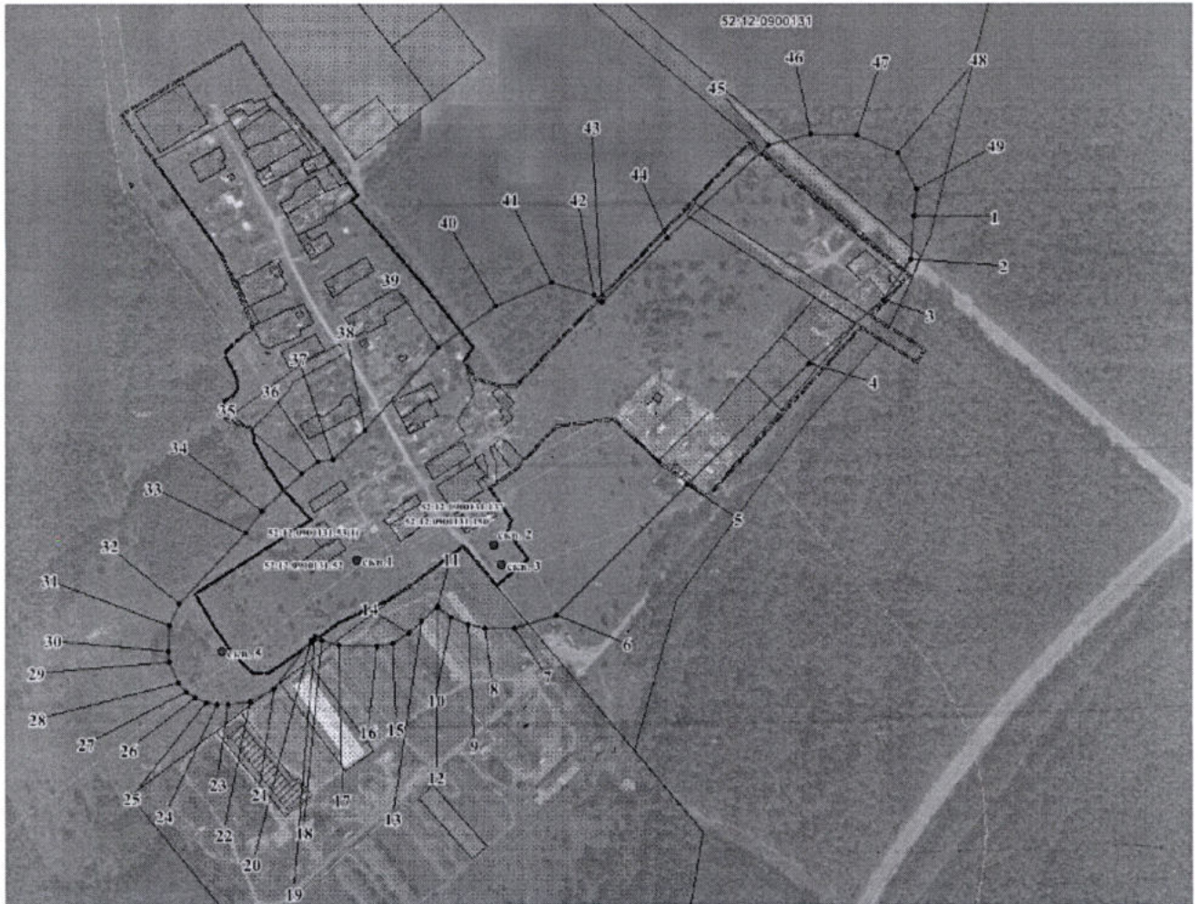
Координаты характерных точек границы третьего пояса ЗСО Водозабора (скважины №№ 1- 3, № 5)

Третий пояс ЗСО скважин №№ 1- 3, № 5 устанавливается единым контуром, по внешним дугам пересекающихся эллипсов, размерами: для скважины № 1 - 476,0*189,0 м (R=388,0 м, r=89,0 м), для скважины № 2 - 694,0*204,0 м (R=605,0 м, r=90,0 м), для скважины № 3 - 350,0*128,0 м (R=290,0 м, r=60,0 м), для скважины № 5 - 303,0*136,0 м (R=245,0 м, r=58,0 м).