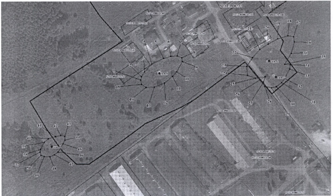
Координаты характерных точек границы второго пояса ЗСО скважин водозабора

Второй пояс ЗСО скважины № 5 в плане имеет форму эллипса, размеры второго пояса составляют 41,0*22,0 м (R=22,3 м, r=18,5 м).