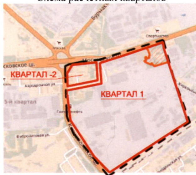
Схема расчетных кварталов