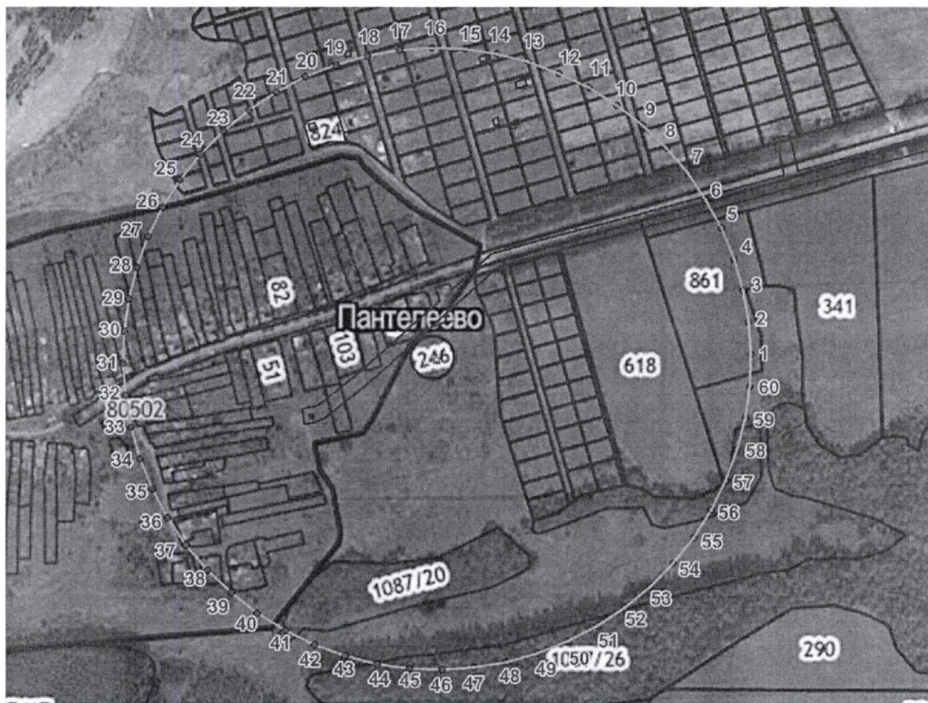
Координаты характерных точек границы третьего пояса ЗСО скважины № 19

Размер третьего пояса ЗСО скважины № 19 составляет 436,0 м.