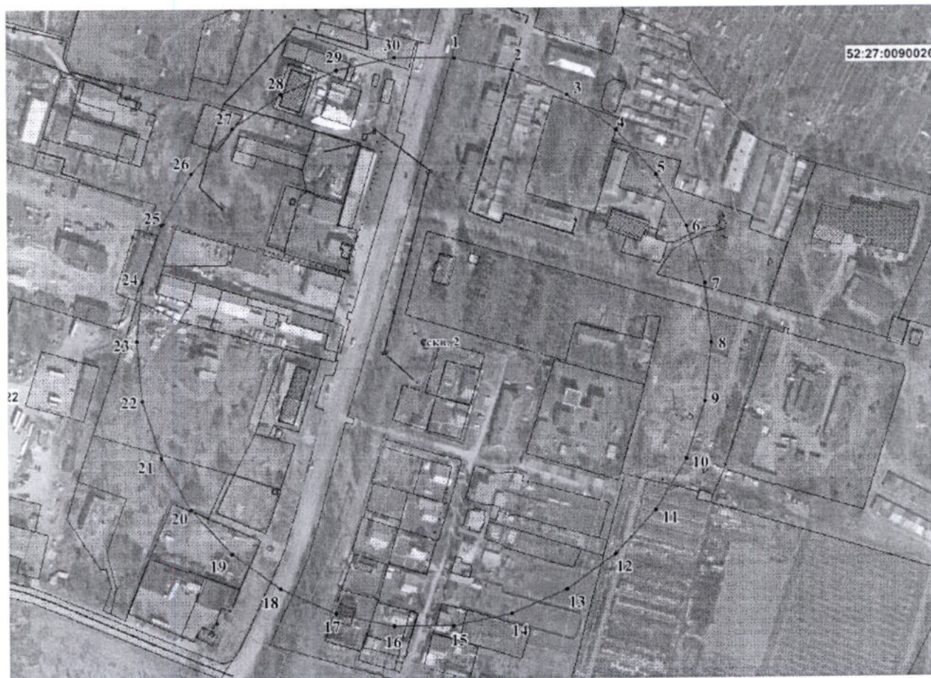
Координаты характерных точек границы третьего пояса ЗСО скважины № 2

Размер третьего пояса ЗСО скважины № 2 составляет 244,0 м.