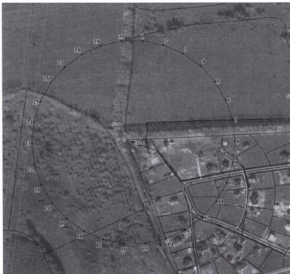
Координаты характерных точек границ третьего пояса ЗСО водозаборной скважины № 1

Размер третьего пояса ЗСО для скважины № 1 определен в результате гидродинамических расчетов. Границы третьего пояса представляют собой окружность, радиус которой составляет 215,0 м. Скважина расположена в центре окружности.