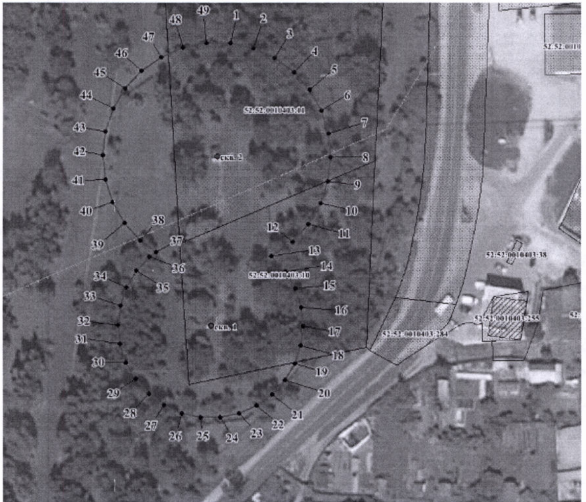
Координаты характерных точек границы второго пояса ЗСО водозаборного участка АО «Выксунский Водоканал»