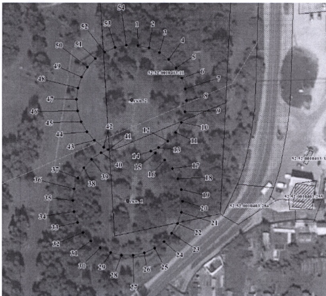
Координаты характерных точек границы первого пояса ЗСО водозаборного участка АО «Выксунский Водоканал»