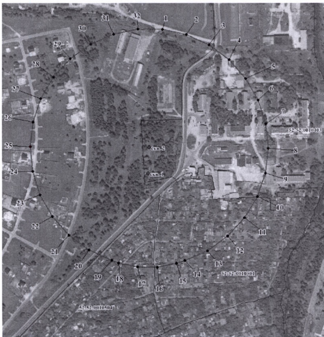
Координаты характерных точек границы третьего пояса ЗСО водозаборного участка АО «Выксунский Водоканал»