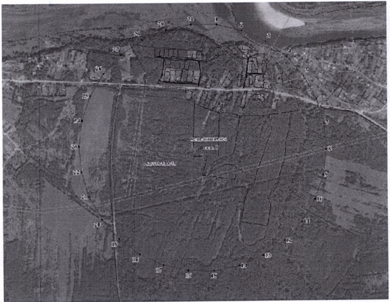
Координаты характерных точек границы третьего пояса ЗСО скважины № 1