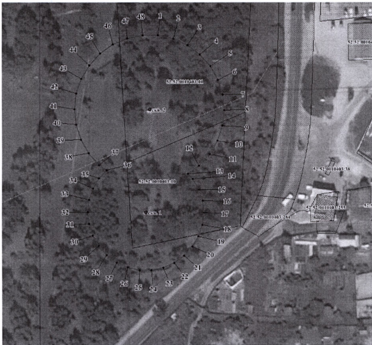
Координаты характерных точек границы второго пояса ЗСО водозаборного участка АО «Выксунский Водоканал»