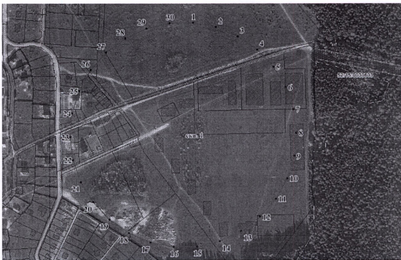
Координаты характерных точек границы третьего пояса ЗСО скважины № 1

3. Граница третьего пояса ЗСО скважины № 1 устанавливается на расстоянии 243,0 м от оси скважины по всем направлениям.