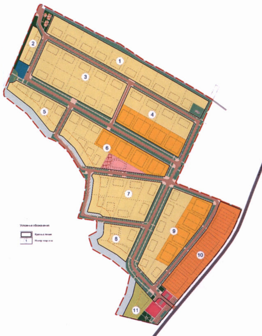
Схема расчетных кварталов.