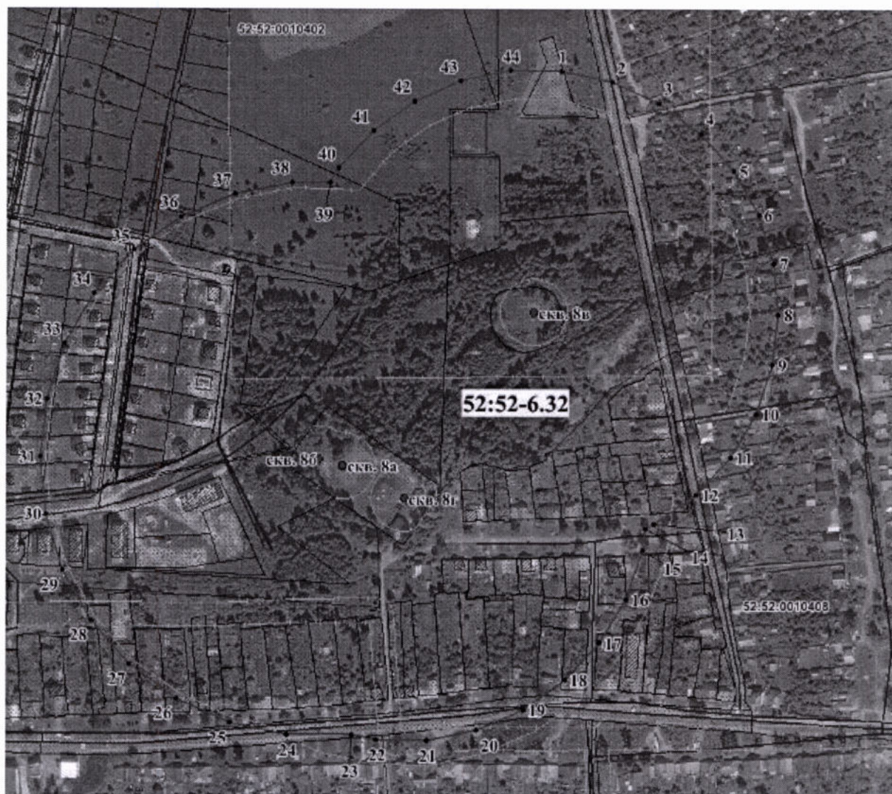
Координаты характерных точек границ второго пояса ЗСО скважин №№ 8а, 8б, 8в, 8г водозабора Антоповского участка Южно- Горьковского месторождения в г.о.г. Выкса Нижегородской области