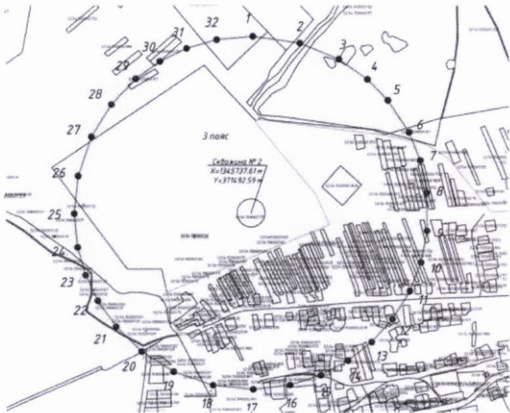
Координаты характерных точек границы третьего пояса ЗСО скважины № 2