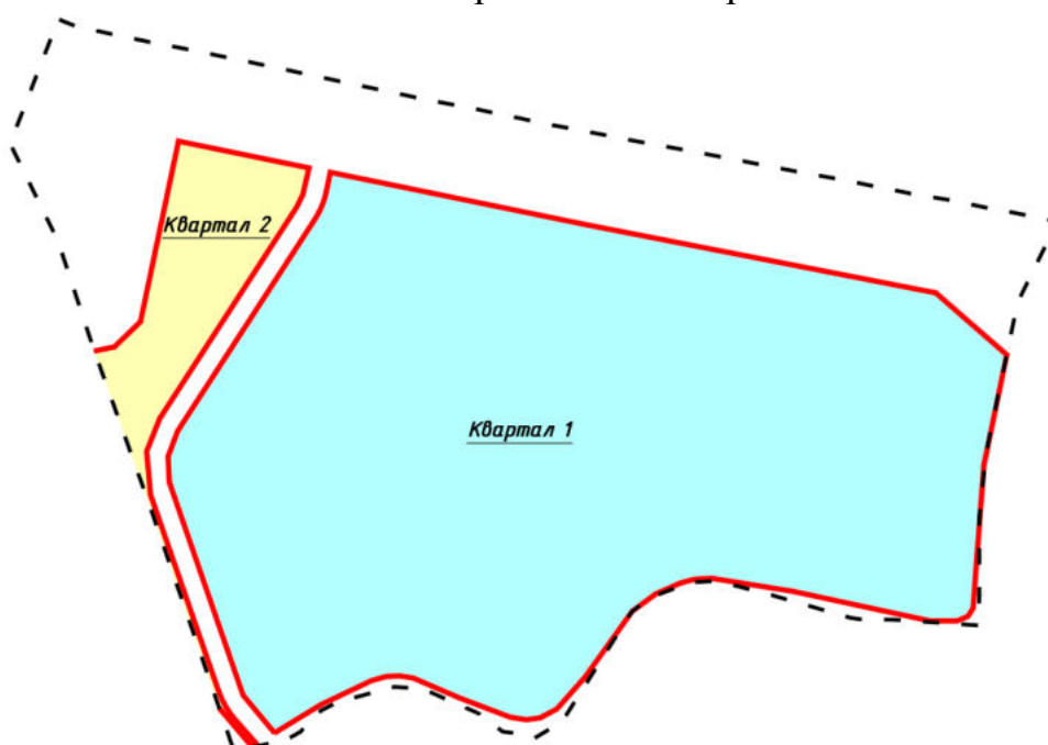
Схема расчетных кварталов