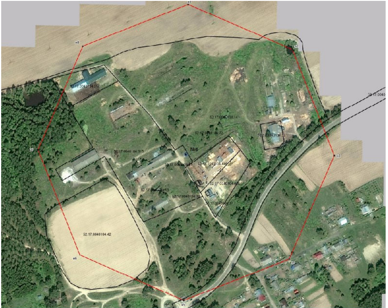
Координаты характерных точек границы третьего пояса ЗСО скважины № 1

3. Граница третьего пояса ЗСО скважины № 1 устанавливается на расстоянии 311,0 м от устья скважины по всем направлениям.