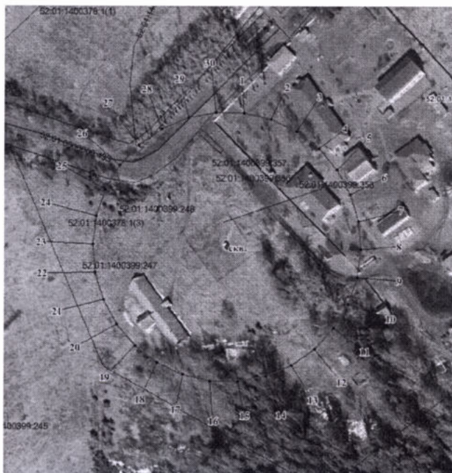
Координаты характерных точек границ второго пояса ЗСО для водозаборного участка

Границы второго пояса ЗСО скважины определены в результате гидродинамических расчетов, имеет форму окружности. По расчетам размеры второго пояса ЗСО составляют 76,0 м.