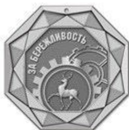
Медаль II степени (серебряная)