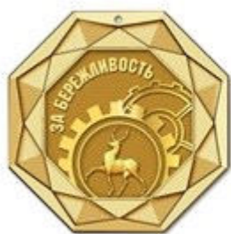
Медаль I степени (золотая)