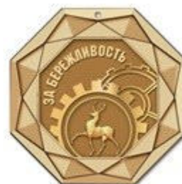
Медаль III степени (бронзовая)