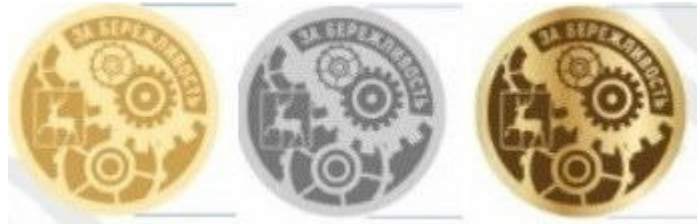
Знак I степени (золотой) Знак II степени (серебряный) Знак III степени (бронзовый)

3. Футляр для Медали размером 185 мм на 140 мм, прямоугольной формы, подложка бархатная (флокированная).