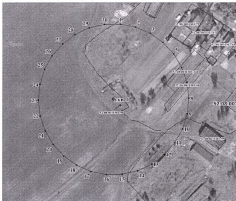
Координаты характерных точек границ третьего пояса ЗСО для водозаборного участка в д. Максимово