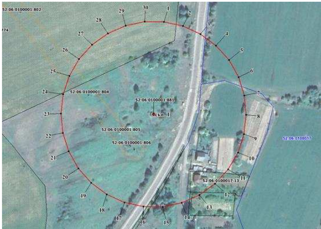
Координаты характерных точек границы третьего пояса ЗСО скважины № 1