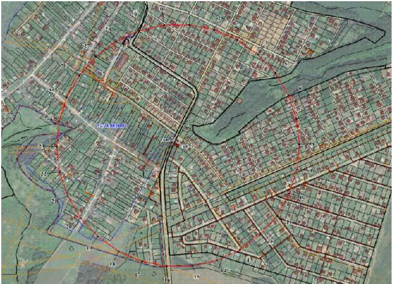
Координаты характерных точек границы третьего пояса ЗСО скважин № 1 и № 2