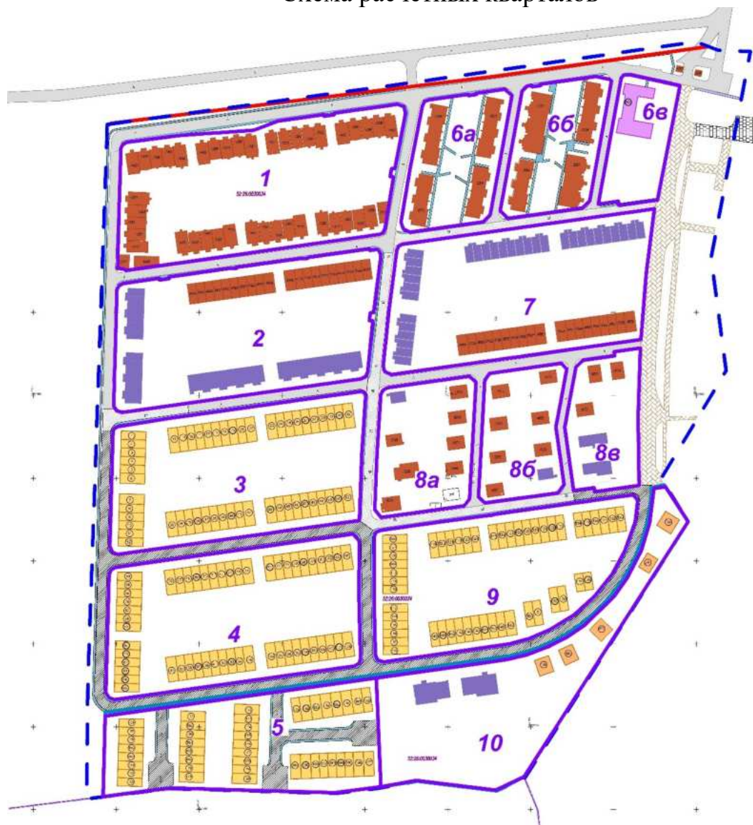
Схема расчетных кварталов