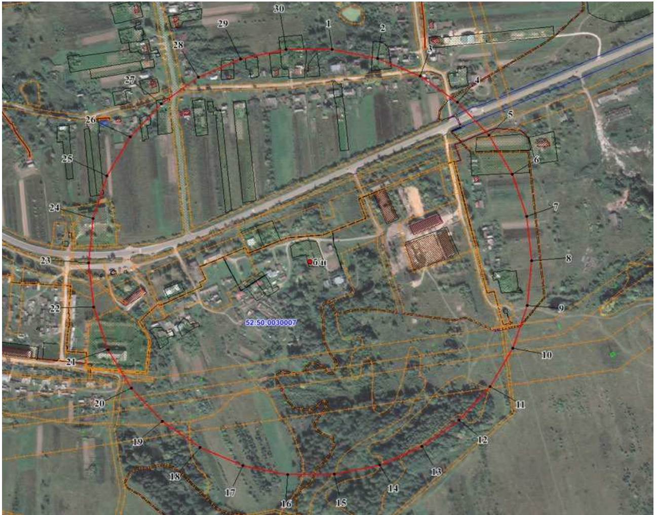
Координаты характерных точек границ третьего пояса ЗСО водозаборной скважины № б/н