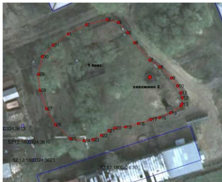
Скважины № 2 и № 3