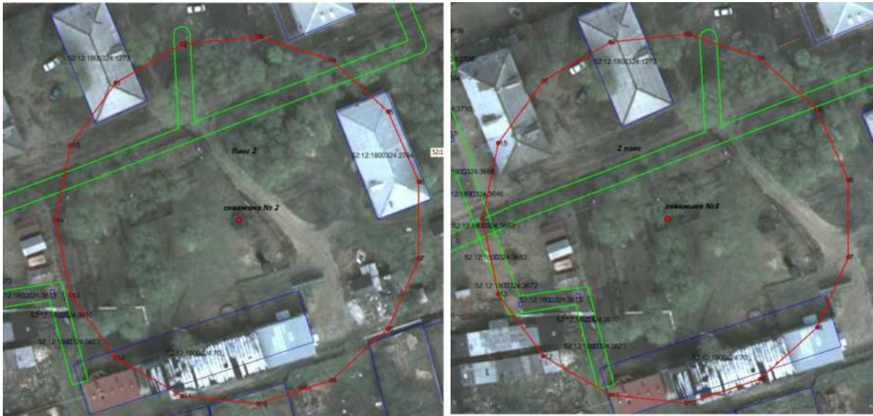
Координаты характерных точек границ второго пояса ЗСО водозаборной скважины № 2