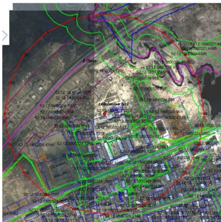
Координаты характерных точек границ третьего пояса ЗСО водозаборной скважины № 1