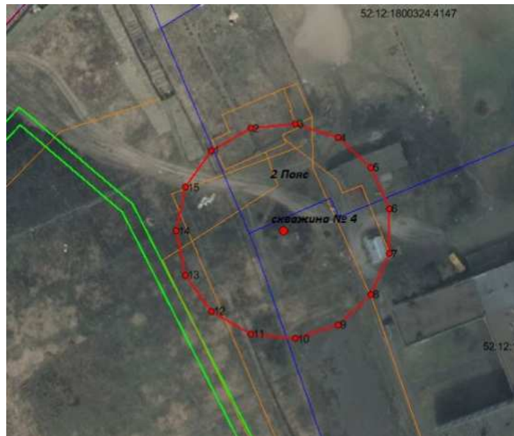
Координаты характерных точек границ второго пояса ЗСО водозаборной скважины № 4