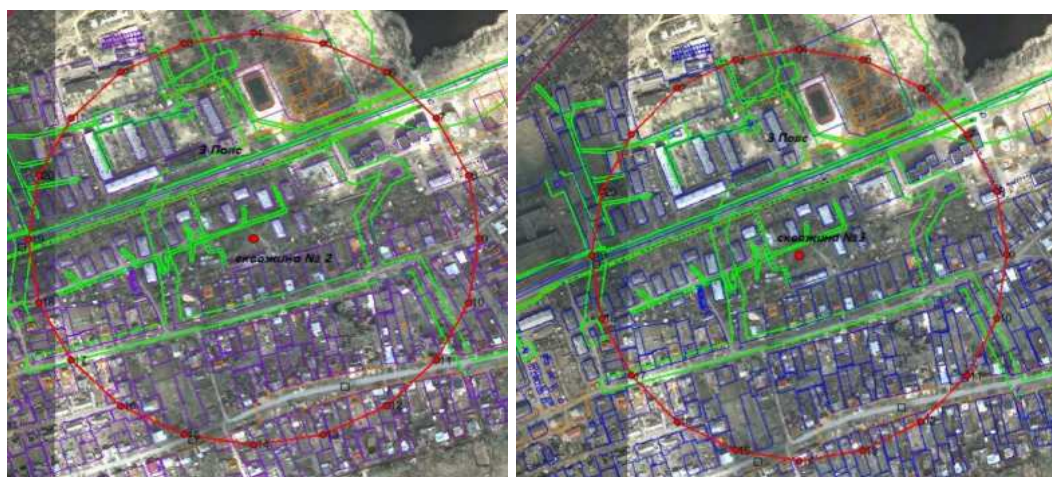
Скважины № 2 и № 3