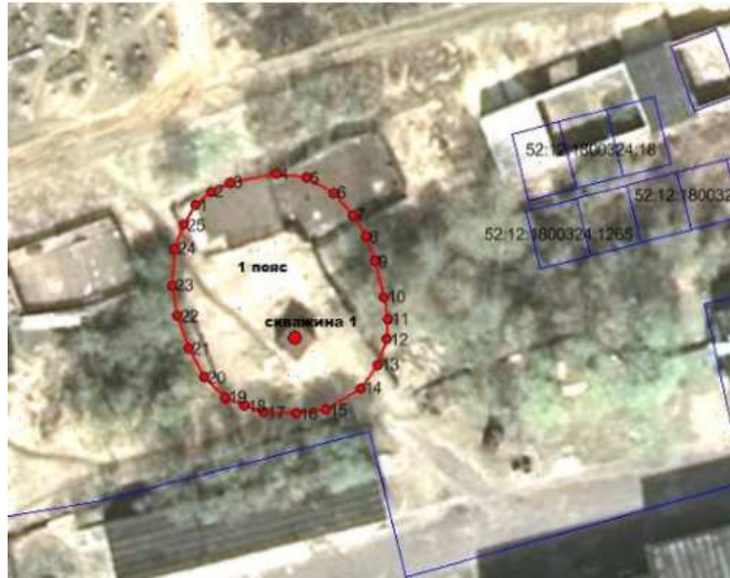
Координаты характерных точек границ первого пояса ЗСО водозаборной скважины № 1