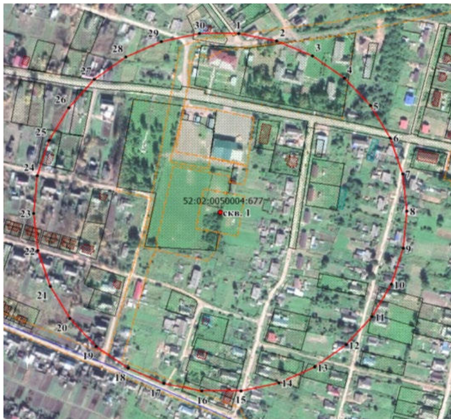
Координаты характерных точек границ третьего пояса ЗСО водозаборной скважины № 3

Размеры границ третьего пояса ЗСО скважины № 3 определены в результате гидродинамических расчетов. Границы третьего пояса ЗСО скважины в плане имеют форму окружности радиусами 266,0 метров.